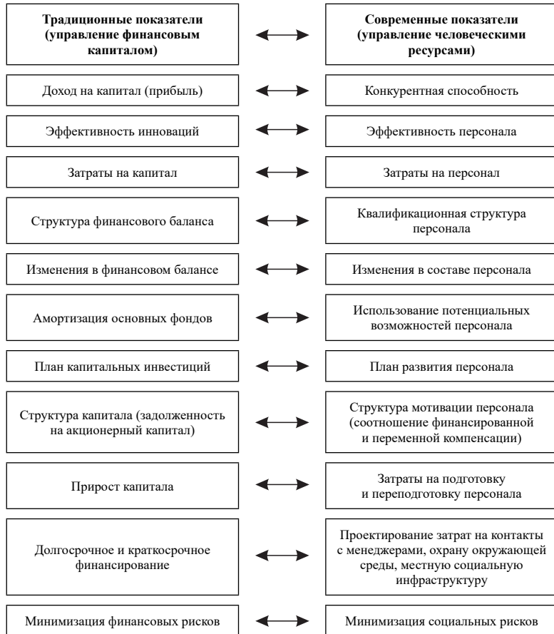
Рис. 1. Критерии эффективности деятельности предприятия 1

Вместо классического экономического детерминизма в духе К. Маркса и А. Смита теоретико-методологической установкой социального аудита является культуроцентристская модель объяснения социально-экономических и социально-трудовых процессов и отношений. Культуроцентристский подход подразумевает определение экономической деятельности в современном капитализме как дея-